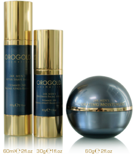
30g e 1.1fl.oz

クレンジングでキメ細かい泡で肌をいたわりながらトラブルの元となる毛穴の汚れや余分な皮脂をやさしく取り除き、ふっくらとなめらかに洗いあげます。心地よい感触と快適感をもたらし香気を感じてほくほくしながら、バランスの乱れがちな肌のコンディションを整えます。肌へのせる瞬間まで新鮮に保つエアレスボトルに詰めました。24K純金箔、ビタミンA、ビタミンE、ハマメリス葉エキス、トウキンセンカ花エキス、アロエバ葉エキス(保湿)などの天然成分から配合されています。