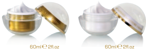
60ml e 2fl.oz