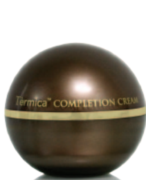
30g e 1.1fl.oz