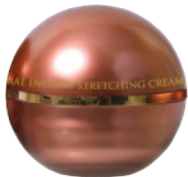
110g e 3.87fl.oz

濃密で心地良く潤いで肌を包み込み、ふっくらやわらかに、美しい輝きやハリが持続し、心まで満たされます。若々しい輝きに満ちた、なめらかな肌へ。24K純金箔、ビタミンC、ビタミンE、DMAE、コラーゲン、アロエラ葉エキス(保湿)など天然成分から配合されています。