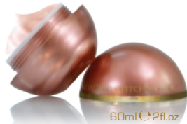
60ml e 2fl.oz