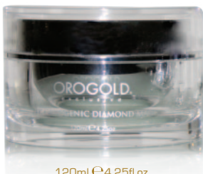
120ml e 4.25fl.oz