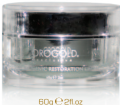
60g e 2fl.oz