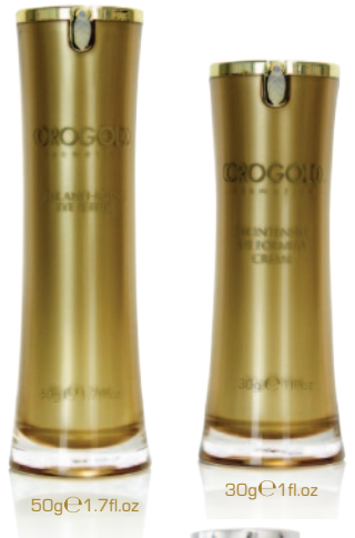
50g e 1.7fl.oz

目もとをうるおいで満たし、ハリをあたえ、明るく、輝きに満ちた目もと印象に導きます。連続的に目元のしむ、ためみ、くすみなどに力強く働きかけます。なめらかでやさしく、肌のにせる瞬間に溶けるような極上のアイクリーム。目もとに希望を集めるような上質な美しさをもたらします。肌のにせる瞬間まで新鮮に保つエアレスボトルに詰めました。24K純金箔、マトリキシル3000、ビタミンA、ビタミンE、カフェイン、ホホバ種子オイル(保湿)、緑茶エキス(保湿)、アラントイン、アロエベラ葉エキス(保湿)、オリーブ果実油、甘草エキスなどの天然成分から配合されています。