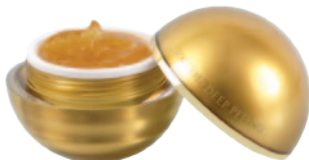
53g e 1.86fl.oz

シワ、ハリ、弾力のなせなどエイジングサインの気になる環境を整えます。つけた瞬間からたっぷりの栄養と潤いで満たして、しわや小じわのないふっくらとした輝かしい美しい素肌へ。24K純金箔、ビタミンA、ビタミンC、ビタミンE、DMAE、カフェイン、コラーゲン、ダイズオイル、海藻エキス(保湿)など天然成分から配合されています。