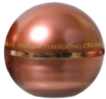
30g e 1fl.oz

たっぷりの栄養と潤いで肌を心地よく包み、疲れのサインを緩和して、乾燥による小ジワを目立たなくし、引き締まったハリ感をもたらします。エイジングケア効果で、肌の奥からラインがふっくらもちあがる、そんな実感を目指します。24K純金箔、ビタミンA、ビタミンC、ビタミンE、DMAE、ホホバオイル(保湿)、コラーゲン、アロエラ葉エキス(保湿)、死海ミネラル泥、イチョウ葉エキスなど天然成分から配合されています。