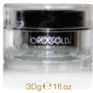
30g e 1fl.oz