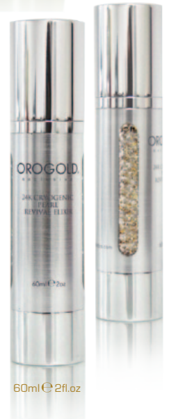
60ml e 2fl.oz