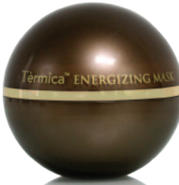
140g e 4.93fl.oz